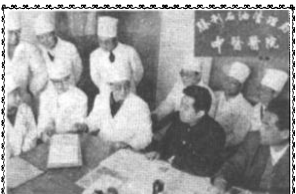
图片新闻 胜利中医院挂牌服务

家里人把我送到了胜利油田中心医院。我带的钱还不够交押金，医院见我病重，未办理住院手续，就优先把我安排到了病房，连续为我输了20多天的液。经过皮肤科医护人员